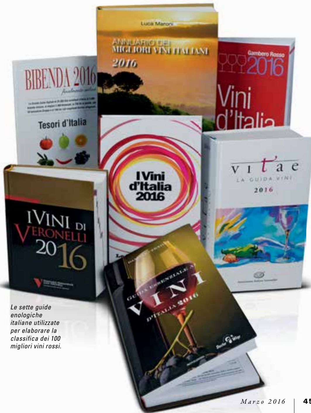
Le sette guide enologiche italiane utilizzate per elaborare la classifica dei 100 migliori vini rossi.

ha determinato la classifica. In cima alla classifica è tornato l'ES, il Primitivo di Manduria, spodestato l'anno scorso dall'intramontabile Sassicaia, che questa volta scivola in terza piazza, perché al secondo posto è balzato (non era mai successo) il Vigna Monticchio, la Riserva di Torgiano creata negli anni 70 del 1900 da Giorgio Lungarotti, precursore in Umbria del Rinascimento enologico italiano . In questa classifica dei migliori rossi italiani, compilata incrociando i voti delle guide dei vini, si avvertono inevitabilmente i contraccolpi della loro moltiplicazione: diventate sette l'anno scorso, le guide sentono come non mai l'esigenza di differenziarsi una dall'altra, e lo fanno cercando di scoprire vini inediti di produttori ancora sconosciuti , ma per sfoltire la scena e permettere agli emergenti di farsi notare hanno preso contemporaneamente l'abitudine di cancellare dalle loro pagine qualcuna delle bottiglie di più riconosciuto valore. Con queste esclusioni, però, è sempre più difficile per i vini d'alto profilo comparire in tutte